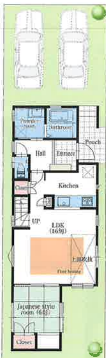
建築確認番号/第H29確認建築受建住セ23313号